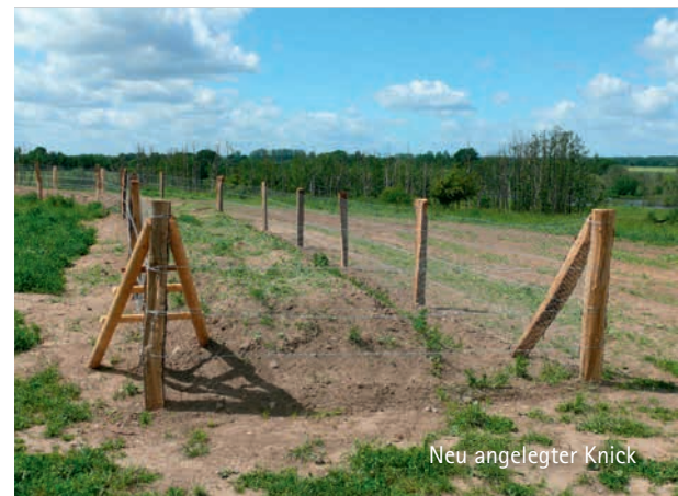
Neu angelegter Knick